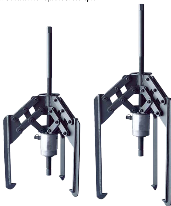
Мощные самоцентрирующиеся гидравлические съёмники